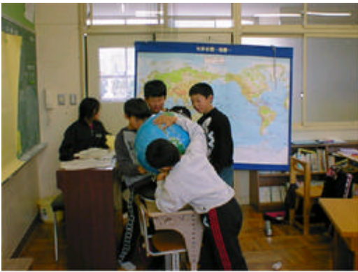
地球儀を見ながら考える子どもたち