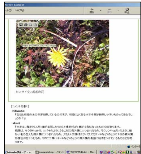
写真1 学芸員からの調査報告