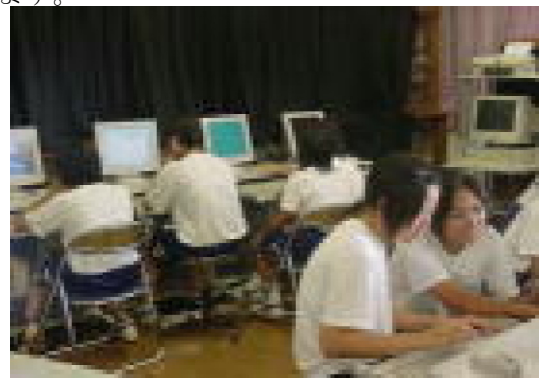
図 1 インターネットによる追求学習

らに意欲的なものとなっています。まとめは、各自スタディノートによる 5 分間プレゼンテーションを作成することとしました。取材も場所を東京都内に広げ、デジタルビデオカメラなどを利用して行いました。このように様々な I T を利用する事により生徒の課題への興味・関心を高め、追求心を深めることができていると考えます。