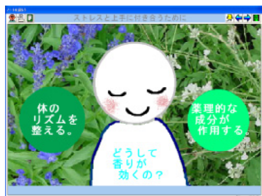
図 2 生徒が作成したレポートの一部