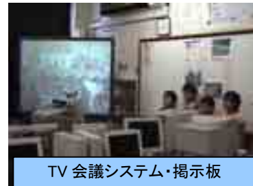
TV 会議システム・掲示板