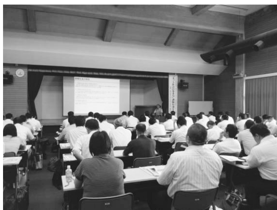
図3 講師育成セミナーの様子

セミナーの総受講者は600名を越え、約半数(291名)が小学校教職員、4分の1がそれぞれ中学校(134名)、高等学校(132名)の教職員であった。また、受講者の6割以上が情報モラル指導者のためのセミナーを初めて受講した教職員であったということもあり、セミナーにて得られた教材や指導方法などは受講者にとって大変有効であったと思われる。その裏付けとして受講アンケートでは、「本セミナーは、今後の情報モラル研修会実施上の参考になるか」という4点満点評価の問に対し93%以上(565名)の受講者が3点以上の評価、「本セミナーで利用した教材は、今後の情報モラル研修会実施の際に活用できるか」という問に対しても、同様に93%以上(567名)の受講者が3点以上の評価をしている。自由記述のコメントをいくつかをみると「最新で、すぐに使える情報ありがたい」「参考になる、読み原稿付きですぐ活用できる資料、教材を紹介頂いた」「わかりやすい映像資料の他にも、指導案やワークシートがあってよい」などのコメントを頂いた。これまで準備が大変だったと思っていた教材がどこにあるのかを知ることができ、それらを具体的に見たり、触れたりする機会を得られた点が有効であったようだ。これら結果を踏まえ、「ネット社会の歩き方」講師育成セミナーは来年度も継続して開催してゆく。