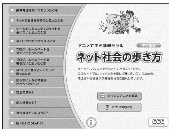
図4 アニメーションアプリ画面

具体的には、iOS と Android をOSとする端末を対象に、それら端末上で動作できるアプリのかたちで情報モラル教材を開発した。教材の内容は大きく分けて2つあり、一つは昨年度開発し、CECホームページ