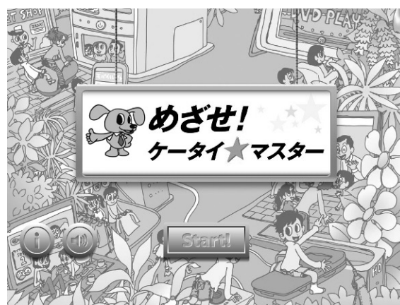
図5 情報モラル理解度チェックアプリ

これらアプリはこれまでCECが提供してきた教材と同様に、教室にて児童生徒向けに教材として利用することも可能であるが、今回のようなアプリでの教材となったことで、家庭で子どもたちに携帯電話を買い与えたとき、子どもたちが使い始めるその前に、保護者と一緒になってこれらアプリを動かし見てみる、情報モラルの理解度をチェックしてみるといった保護者が利用する方法も可能になった。(教室での利用方法は分科会Cの「短学活で誰でもできるケータイ指導」を参照。)