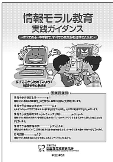
図1 情報モラル教育実践ガイダンス

しかし、ページ数の制約があったため、指導用教材や指導事例、モデルカリキュラムと対応したデジタル教材については、文部科学省と連携の上、CECの新「ネット社会の歩き方」各事業に委ねられた。