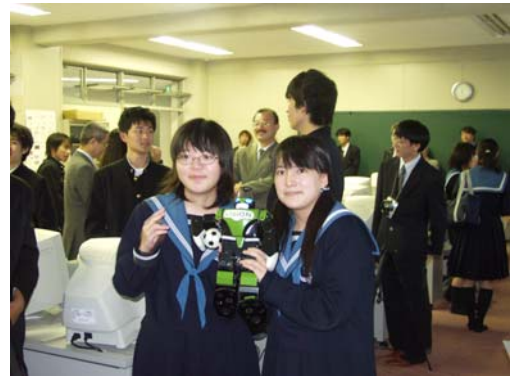
写真4 授業のあとは撮影会に