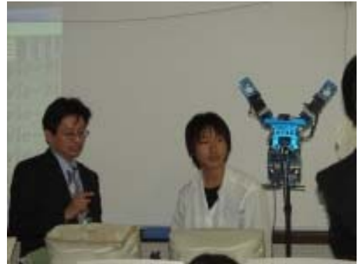
写真3 モーションの編集体験