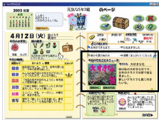
図4 「Web 学級日記」の 今日のできごと&ニュース