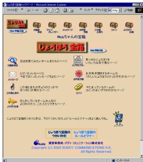
図5 「じょうほう宝箱」のトップページ

「Web 学級日記」には、登録した学校同士お互いに自分たちの日記を見せ合い、それを基にメッセージを送ったりしながら交流ができる「じょうほう宝箱」というインターネットを利用した仕組みがある。今年度はその仕組みを利用して、情報モラルを考え、学習するプロジェクトを始めている。