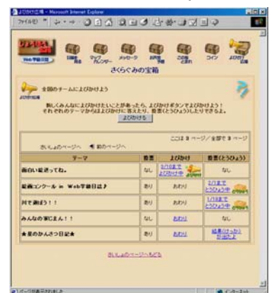
図6 『よびかけ広場』のページ

日々の学級日記の活動が、子どもたちの学力の向上や定着にどのように結びついているのか？それを明確にしていくために、大学の先生、学校の先生方と共同で研究をすすめていきたい。さらに、この取り組みには、教師の指導が必要である。子どもたちの学力と、「Web 学級日記」を教師がどう結び付けていくのか？そこもあわせて、今後、明らかにしていきたい。