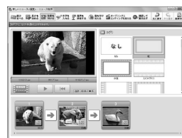
写真3 ニュース番組制作

動画や静止画、音声を使って、ニュース制作やコーナーの制作ができます。各作業ごとに“プロ”のアドバイスを表示するエリアがあり、ポイントがわかります。（写真3）