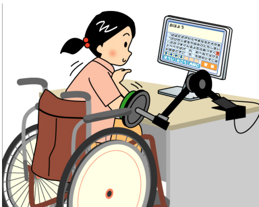
図 9-4 スイッチ操作による障害者用ワープロソフトで文字を綴っているところ

特別支援学校の学習指導要領においては「児童生徒の身体の動きや意思の表出の状態等に応じて、適切な補助用具や補助的手段を工夫するとともに、コンピュータ等の情報機器などを有効に活用し、指導の効果を高めようとする。」「児童生徒の学習時の姿勢や認知の特性等に応じて、指導方法を工夫すること。」と規定されており、情報機器や支援機器を扱うに当たっての身体の状態や動き方に配慮する必要がある。