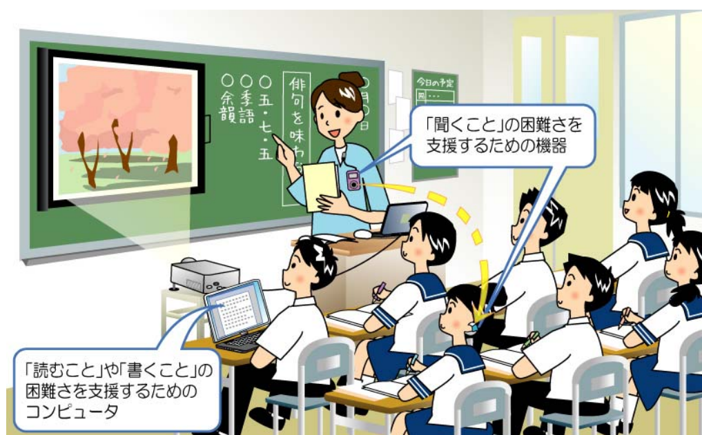
図 9-2 ICT を活用して障害のある児童生徒も一緒に授業を受けている様子

このように、障害のある児童生徒の教育においては、必要に応じてこのような支援機器と技術を活用することが大切である。最近、情報機器の発達により、多様なニーズに応じた機器が開発され、また利用されつつある。今後はますますこうした機器による支援方策に期待が集まり、利用も進むと考えられるが、そのためには更なる研究開発と、第7節で述べるサポート体制の整備が望まれる。そのためにも、メーカーとリハビリテーション工学の専門家、地域の特別支援教育センター等の関係機関と学校、そして保護者との連携・協力が求められる。