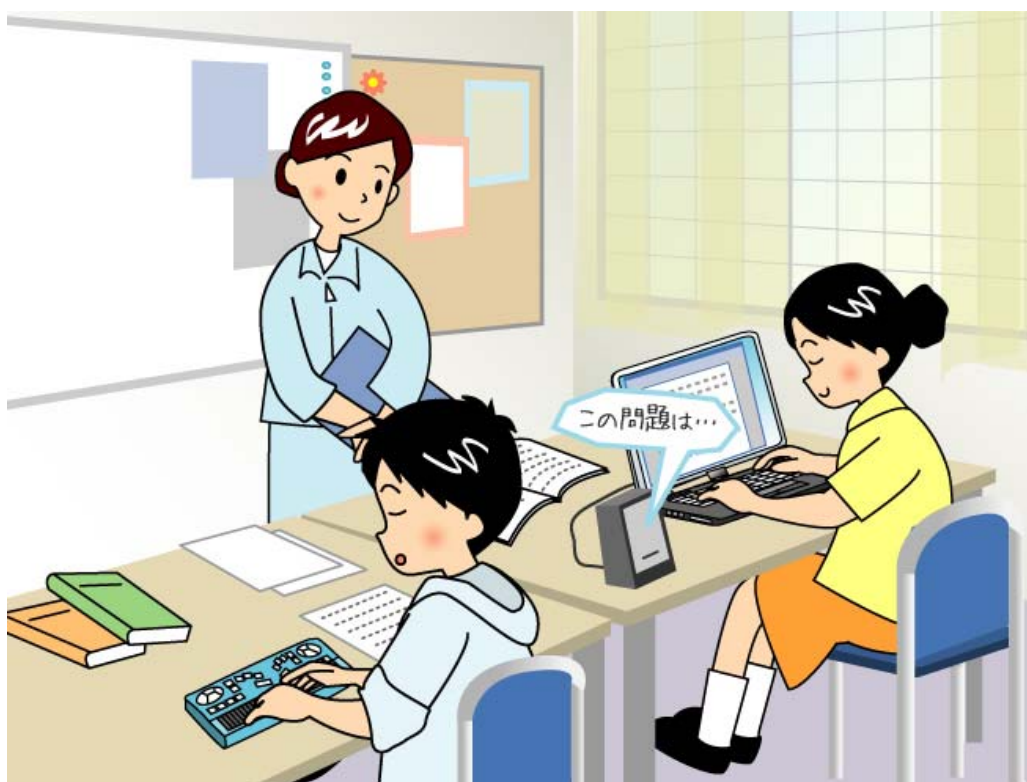
図 9-3 視覚障害者用のピンディスプレイや音声リーダーを使った授業の様子